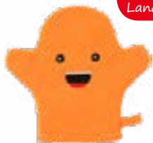
Badehandschuh für Kinder, 20x19 cm, versch. sortiert