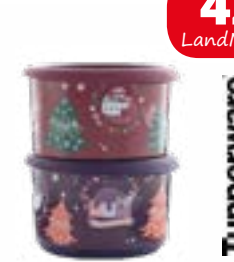
Dosen-Set 2-tlg. Advents-Runde, je 575 ml