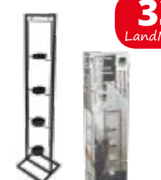
Kerzenhalter-Turm für 4 Teelichter, 70x14 cm