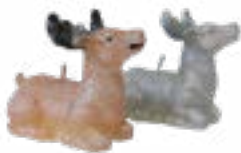
Weihnachtskerze Hirsch, versch. sortiert, 7x8 cm