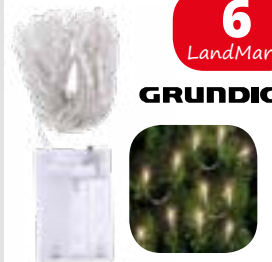
Lichterkette mit 50 LED für Innenräume, L 510 cm