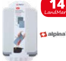
Schneidmatten-Set 3-tlg. für Lebensmittel oder als Bastelunterlage