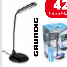
LED-Lampe mit Qi-Ladefunktion, 10 W