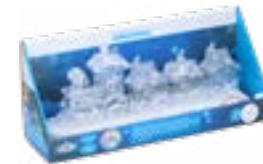
Deko-Zug aus Acryl mit Beleuchtung und 8 Musiktiteln, L 31 cm