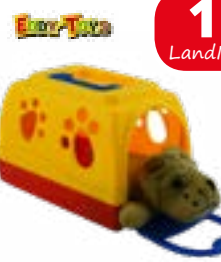
Plüschhund mit Transportbox, von Eddy Toys