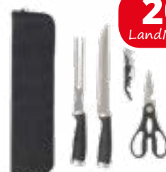
Edelstahl-Tranchierbesteck „ROASTY“ 4-tlg. inkl. Nylontasche