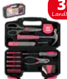
Werkzeugkoffer „Ladies“ 39-tlg., von Kinzo