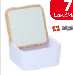
Schmuckkästchen mit integriertem Spiegel, 13x13 cm