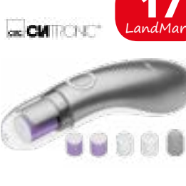
Maniküre-Pediküre-Set inkl. 5 Aufsätze, von Clatronic