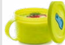
MicroTup Suppentasse, Mikrowellengeeignet, 460 ml