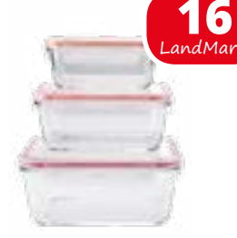
Frischhaltedosen-Set 3-tlg., BPA Frei, 2,3, 1,2 & 0,9L