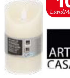
LED Kerze Echtwachs, Batteriebetrieb, 13 cm