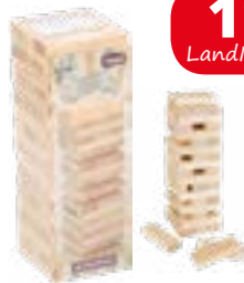
Wackelturm-Spiel aus Holz 60-tlg., von Lifetime Games