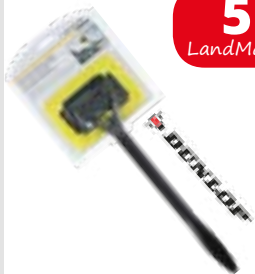
Mikrofaser-Scheibenreiniger, Waschbar, 39 cm, von Dunlop