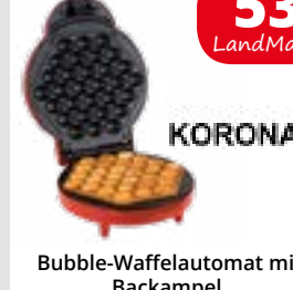
Bubble-Waffelautomat mit Backampel, Temperaturregelung und Antihaf, 1000 W