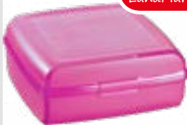
Aufbewahrungsdose MULTISnap für Kleinteile o. als Brotdose verwendbar