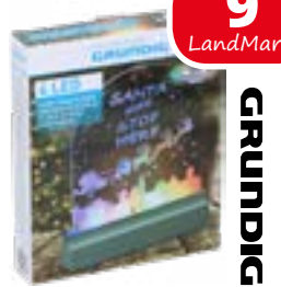
Weihnachtsschild mit 4 LED, 23x19 cm, von Grundig