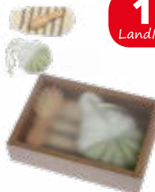
Wellness-Set „SHORT WAVE“ 3-tlg. in Geschenkbox