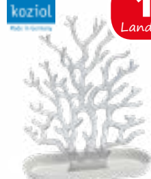
Schmuckorganizer im Korallen-Design, 40x27 cm