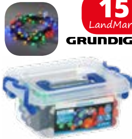
LED-Lichterkette 50er Multi-color, 8 Lichtmodi, L 690 cm